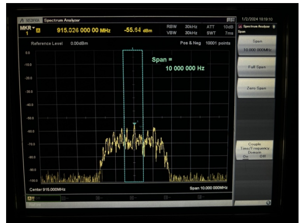
그림 3. 송신 신호의 스펙트럼

송신 신호의 스펙트럼이 그림 3 과 같이 표시되었고 이는 \pi/4 QPSK 신호의 스펙트럼과 동일하게 관측된다.