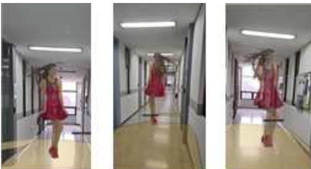
그림 2. 포인트 클라우드 비디오 재생 결과

재생 실험은 삼성 갤럭시 노트 23 울트라 모델을 사용한 Android 14 (API Level 34), RAM 4GB 환경에서 진행하였다. Google AR Core 의 AR Plane Manager 를 통해 현실 세계에서 포인트 클라우드 객체가 렌더링 될 바닥을 검출하고, Polygon Plane 으로 표현한다. 그림 2 에서는 복도의 특정부분이 노란색 Polygon Plane 으로 표현된 것을 볼 수 있다. 또한, 화면의 증점으로부터 Ray Casting 을 통해 Polygon Plane 과 가상의 광선이 처음으로 교차하는 지점의 좌표를 특정하고 Position 으로 추출한다. Position 은 Vector3 형식으로 제공되어 테스트 시퀀스가 안드로이드 기반의 포인트 클라우드 비디오를 재생할 수 있다. 재생 결과는 그림 2 와 같다.